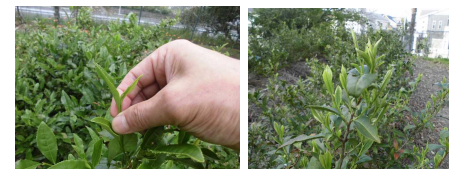
「南部茶園」のお茶の木

3年の「お茶摘み体験」はできませんでした。南部茶園(南部の森)のお茶の木が、今年初めてお茶摘みができるぐらいに生育しましたので、先生たちでお茶摘みをし、手もみで煎茶とほうじ茶などを作りました。3年の児童には、その様子を伝え、できたお茶に触れてもらう予定です。