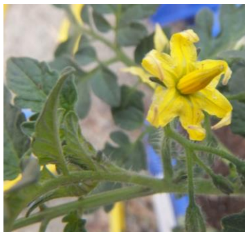
花がさいているお友だちのなえも ありますよ！