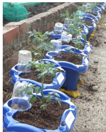
こんな感じになりました！