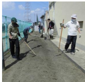
次に、福祉委員のみな さんが、くわでうねをつ くってくださいました！ サツマイモのフカフカ のお布団です！