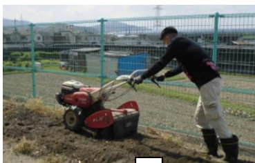
かたくなった土を、機械で ほりおこしていきます。 この作業がとても大切！