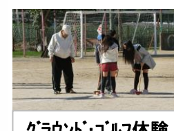
グラウンド・ゴルフ体験