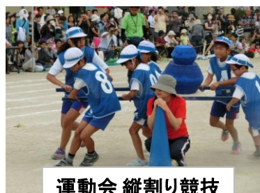
運動会 縦割り競技

様々な集団活動を通して、児童が協力してよりよい学校生活を築こうとする自主的・実践的な態度を養い、心身の調和のとれた発達と個性の伸長を図る。そのために、異年齢集団活動や自主的活動の充実を進める。