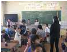
外国語学習部会授業研究