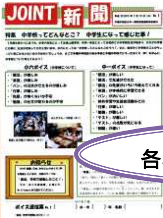
各校の小中一貫教育コーナー