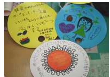
東北に送られた励ましの「うちわ」